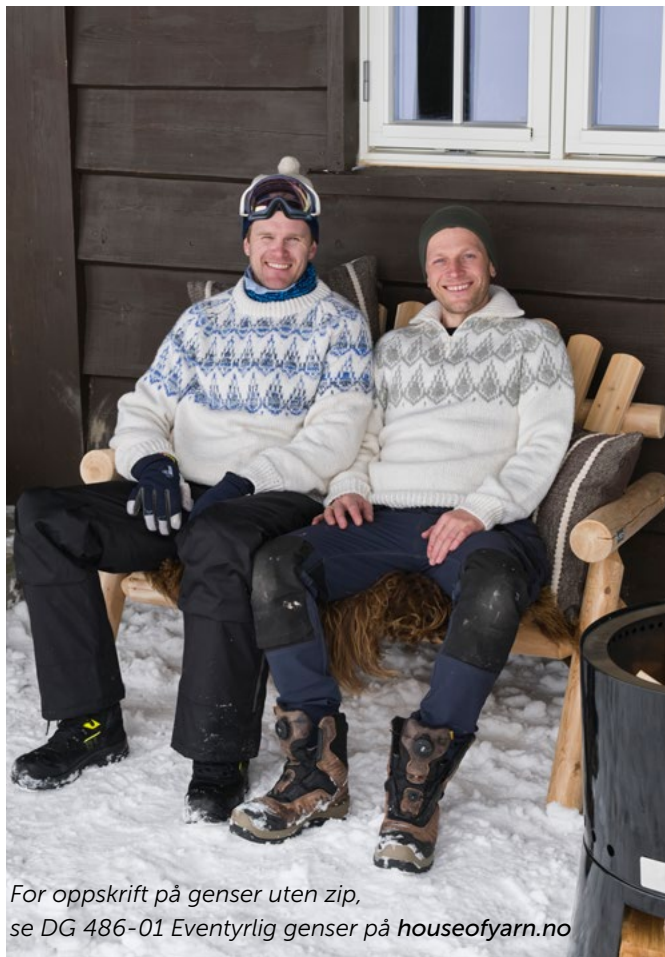
For oppskrift på genser uten zip, se DG 486-01 Eventyrlig genser på houseofyarn.no