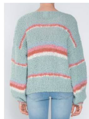
FNUGG Perlemint 912, Aprikos 911, Hvit 902, Myk korall 910, Himmelblå 904