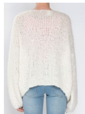
Se også CP-40 DANDELION FNUGG Hvit 902