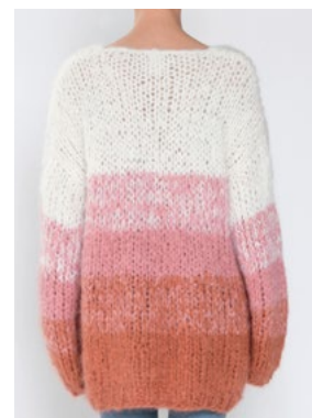
Se også CP-29 TULIP FNUGG Hvit 902, Myk korall 910, Aprikos 911