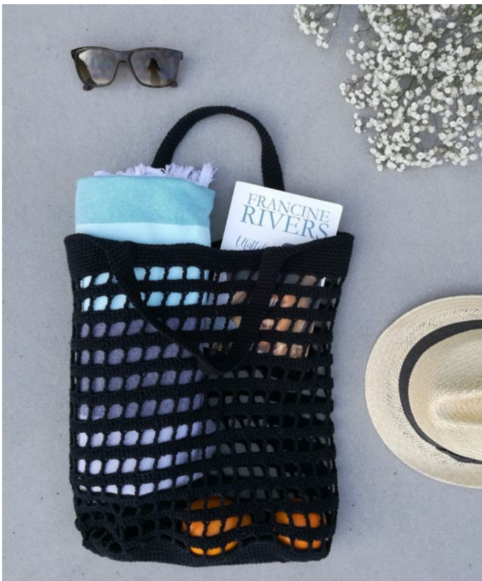
Karianne rutenett | GG18-05