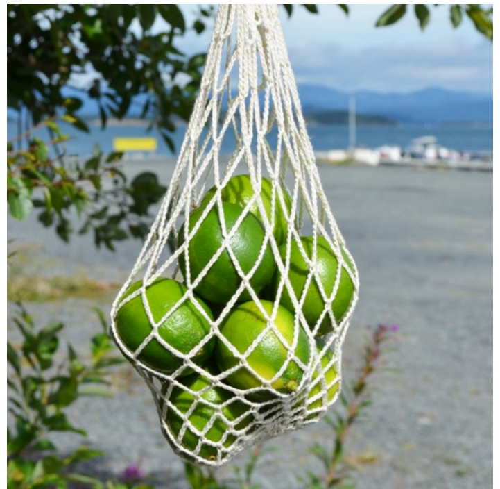
Frukt - og grønnsaksnett | GG18-03