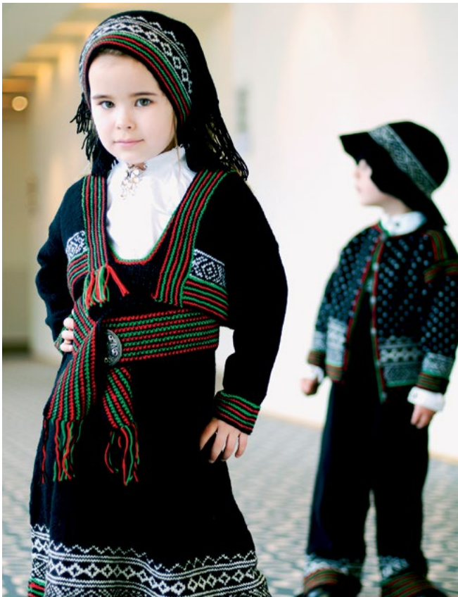
For oppskrift på Setesdal Festdrakt til jente se | GG213-10A