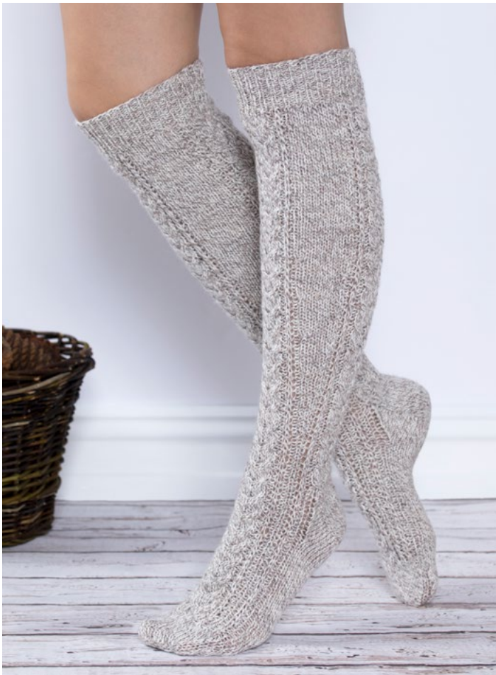
Se også lange strømper | GG275-03