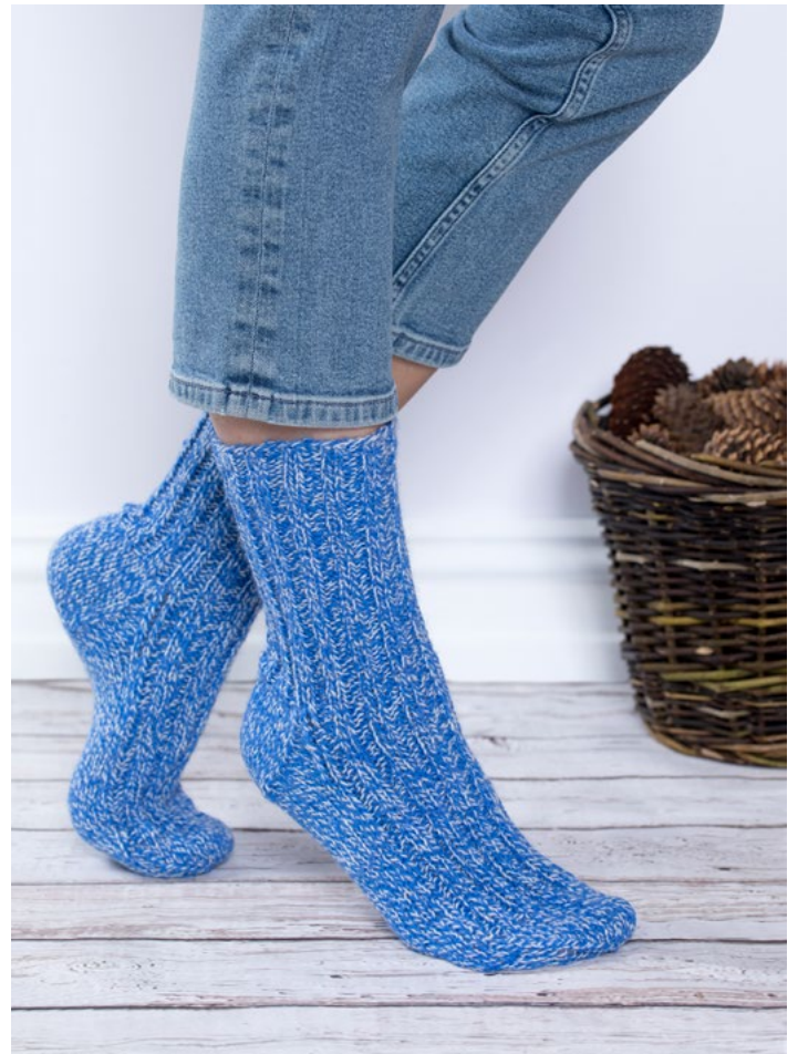
Se også raggsocker | GG275-05