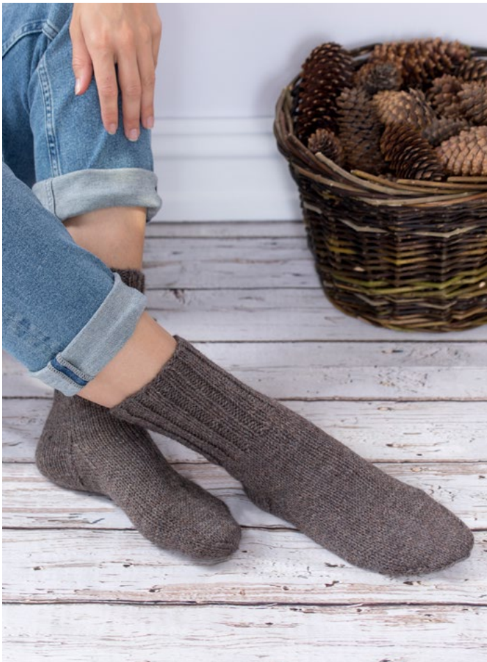
Se også korte sokker | GG275-01