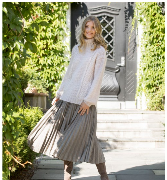
Prøv den i lys beige | 276-07