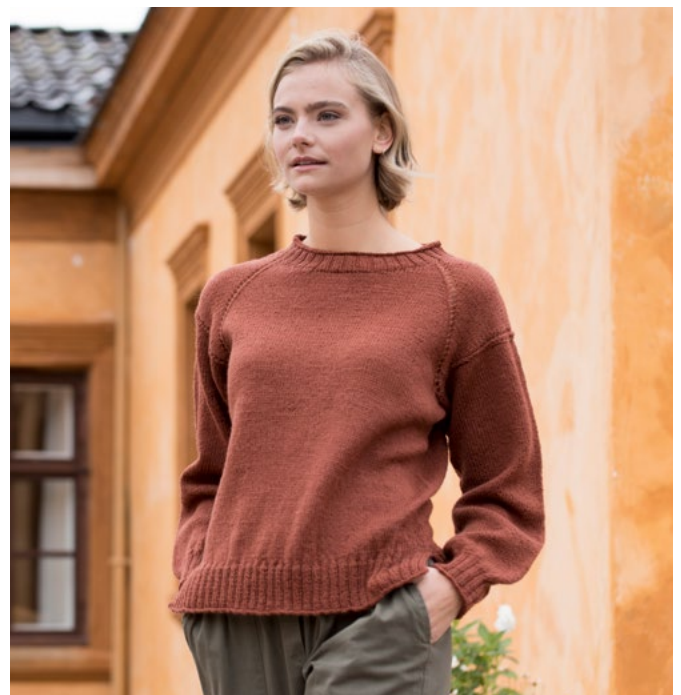
Prøv den som genser | GG279-04