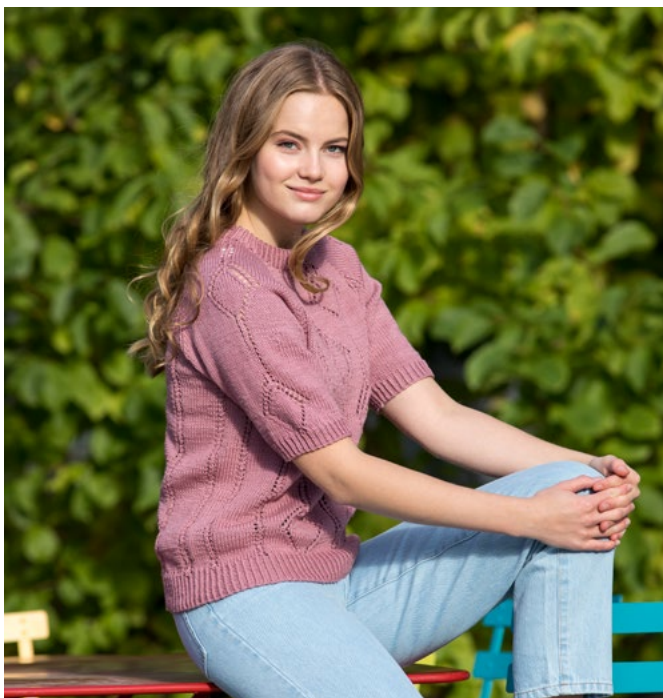
Se også oppskrift på jumper | GG280-02