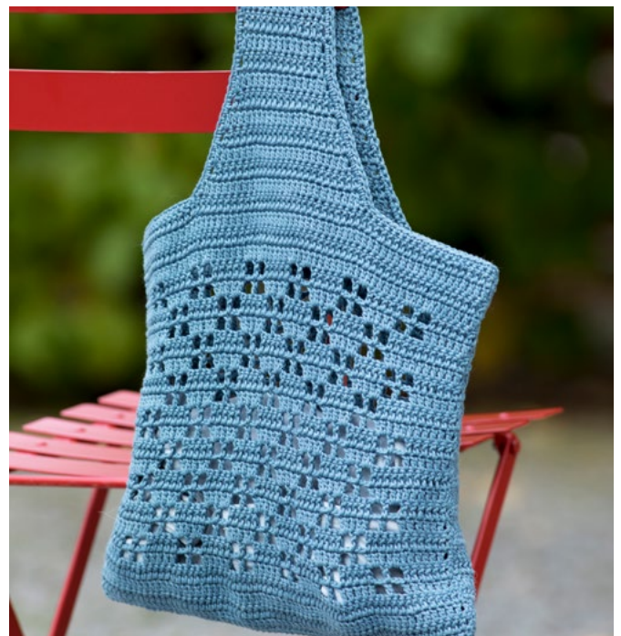
Prøv den i lys denim | GG280-04