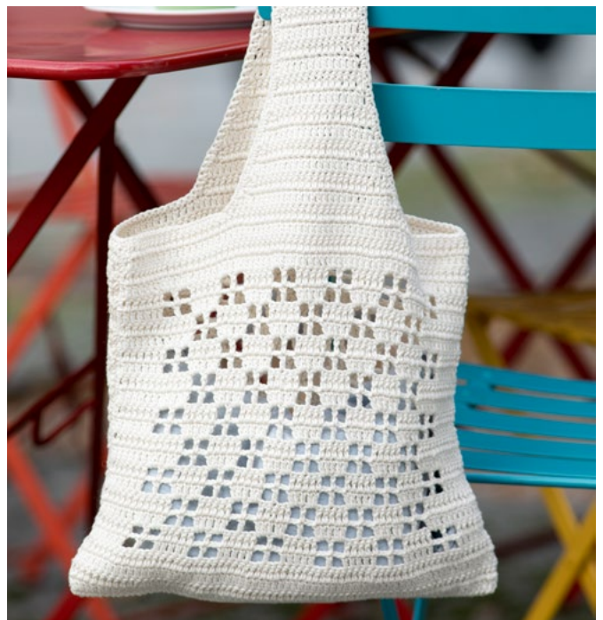
Prøv den i natur | GG280-03