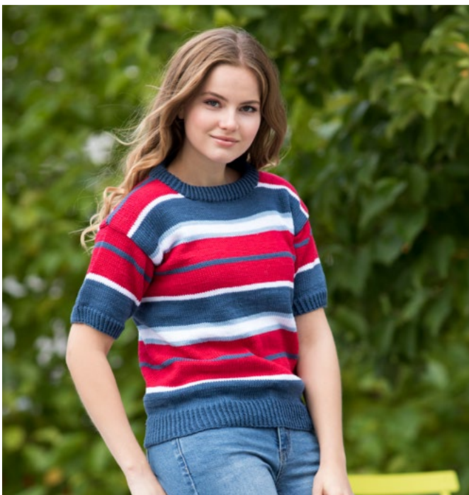
Se også oppskrift på jumper | GG280-05