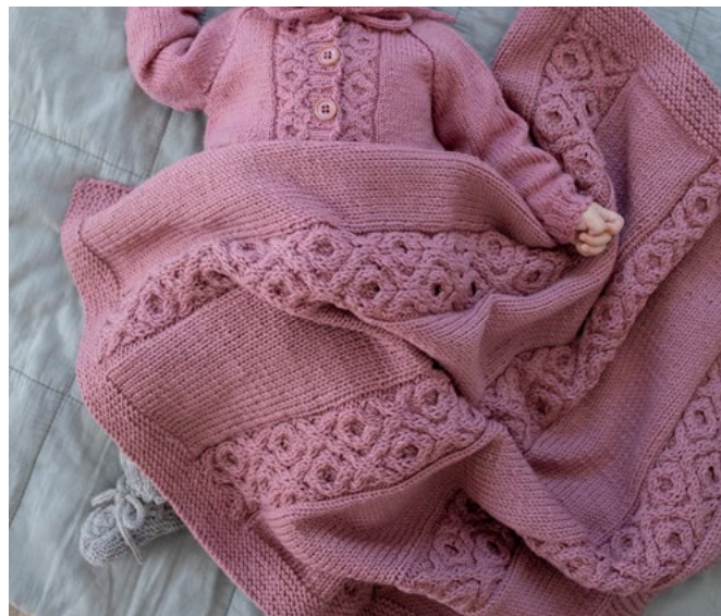
diagram B (= 16 m), 2 m vr fra retten / r fra vrangen, 18 m glattstrikk*. Gjenta fra *-* i alt 3 ganger, men siste gang strikkes kun 16 r, slutt med 8 m rillestrikk. Strikk til arbeidet måler ca 66 cm. Slutt etter en hel eller en halv rapport av diagrammet i høyden. Strikk 1 p r, og fell 4 m jevnt fordelt over hver flette (tilsvarende økningen på begynnelsen av flettene) = 132 m. Skift til p nr 4, og strikk 4 cm riller over alle m. Fell passe løst av.

Fortsett med denne inndelingen: 8 m rillestrikk, 16 m glattstrikk, *2 m vr fra retten / r fra vrangen, mønster etter