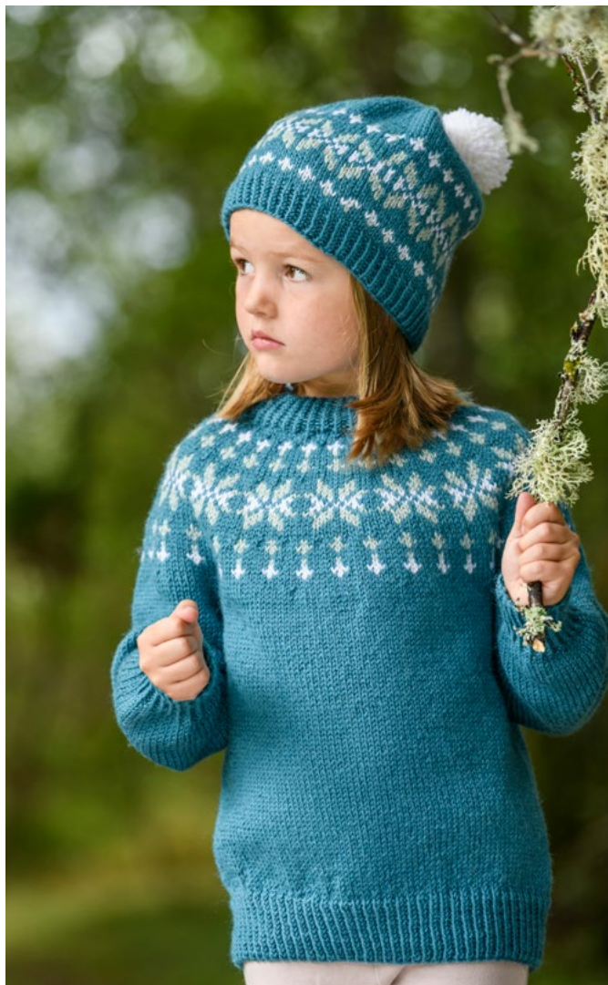
For oppskrift på lue se GG

Skift til p nr 4. Strikk glattstrikk, samtidig som det på 1. omgang økes 3 m jevnt fordelt = 41 (43) 45 (47) 49 (51) m. Sett et merke rundt 2 m midt under ermet = merke-m. Når arbeidet måler 6 cm, økes 1 m på hver side av merke-m. Gjenta økningene på hver 2,5. (2,5.) 3. (3.) 3. (2,5.) cm i alt 6 (7) 8 (9) 10 (11) ganger = 53 (57) 61 (65) 69 (73) m. Strikk til ermet måler 24 (27) 33 (36) 38 (40) cm. På siste omgang felles 10 m av midt under ermet (= merke-m + 4 m på hver side) = 43 (47) 51 (55) 59 (63) m. Strikk det andre ermet på samme måte.