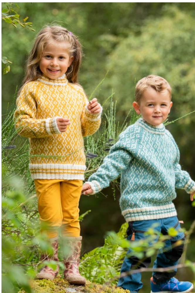
For oppskrift på blågrønn genser se GG 287-25