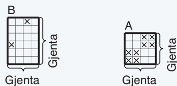
DIAGRAM A, B

Kanter rundt ermehull: Strikkes som halskanten.