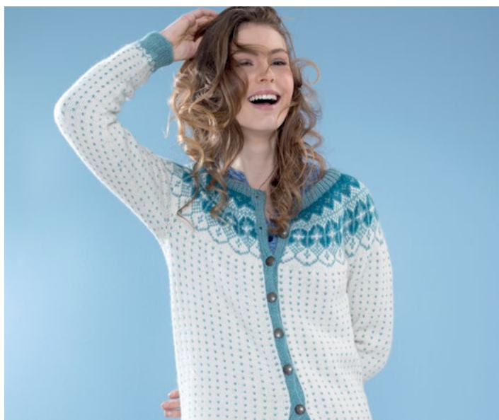
Se også | DG 376-02