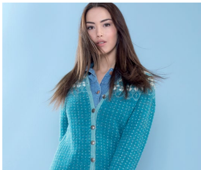
Se også | DG 376-03