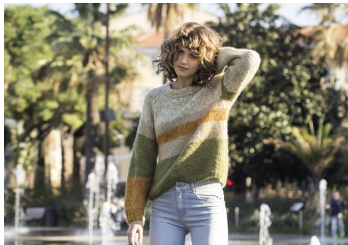
Genseren finnes også med flere farger | DG 379-02