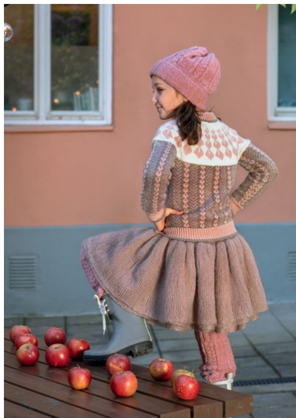
Skjørtet i gammelrosa | DG391-15