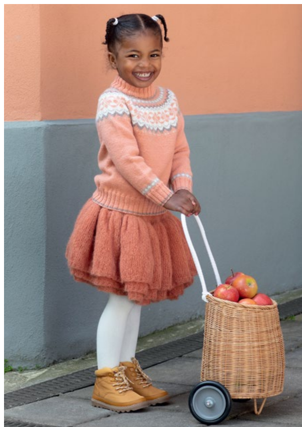
Skjørtet i aprikos | DG391-02