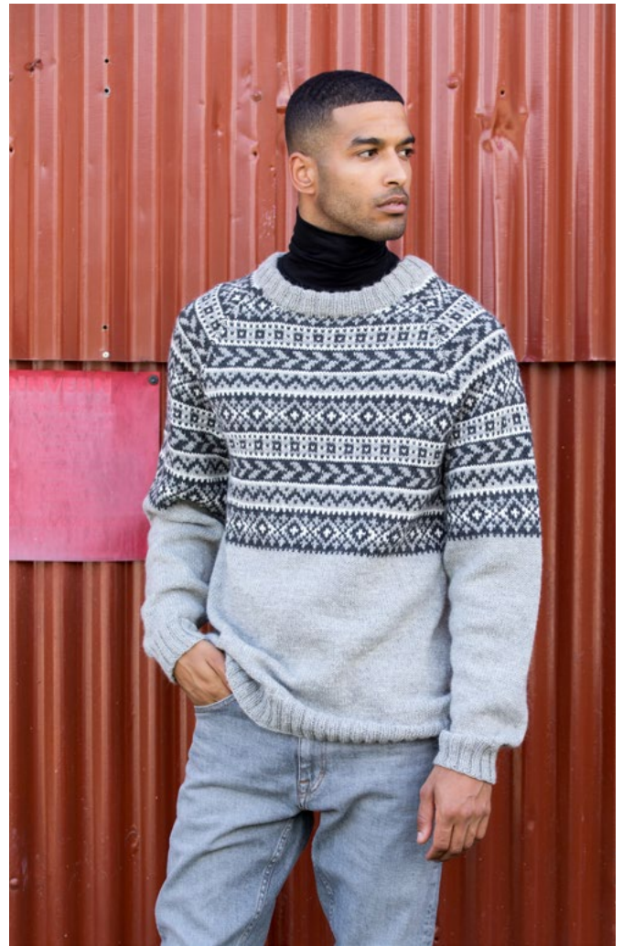
STYLIST: JAN GUNNAR SVENSON @STYLESVENSON

r = rett, vr = vrang, m = maske, p = pinne