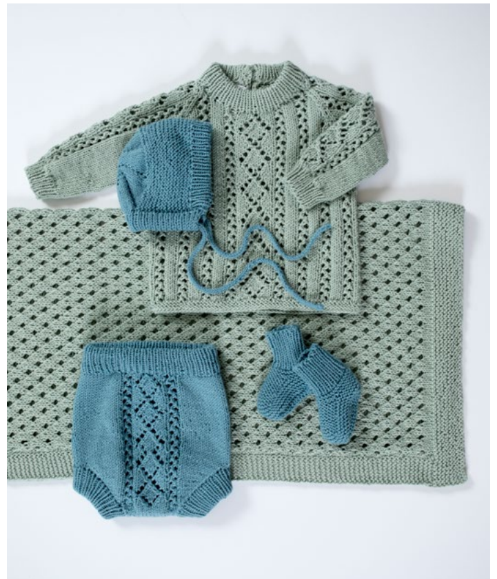
Se oppskrift på hentesett | DG396-02