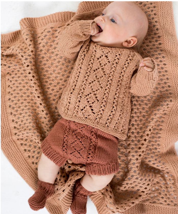
Se også i lys karamell | DG396-06