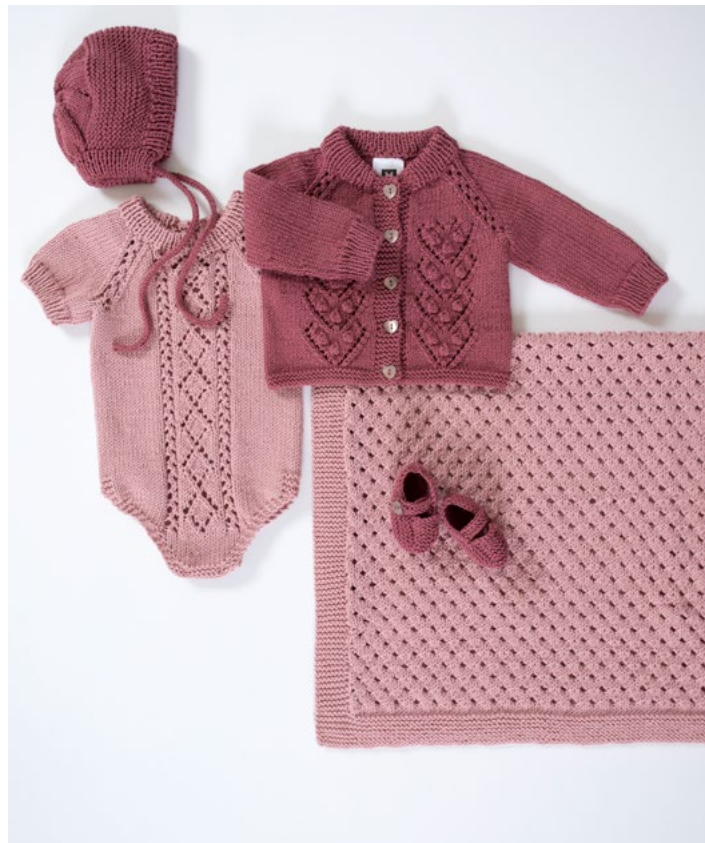
Se oppskrift på hentesett | DG396-03