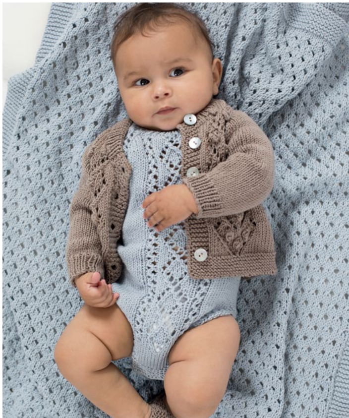
Se også i lys gråblå | DG396-08