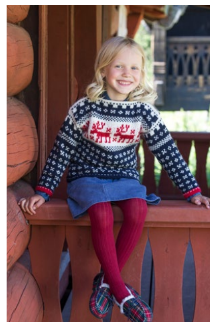
Oppskrift på barnegenser | 402-05