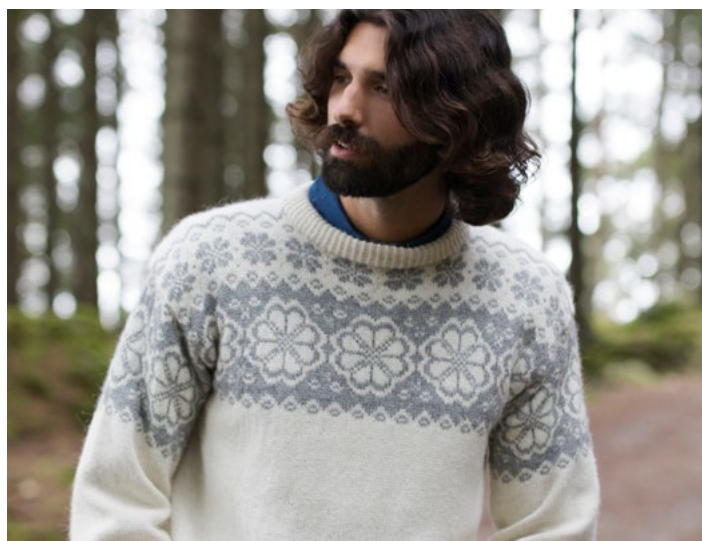
Se også i natur | DG406-11