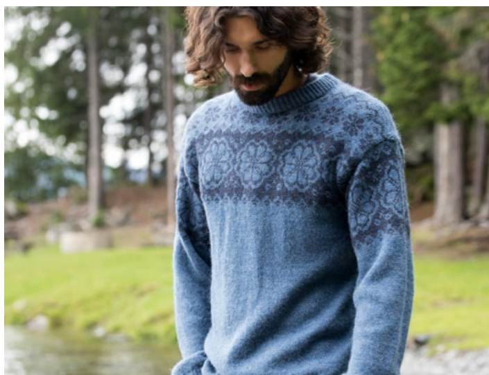
Se også i denim | DG406-04