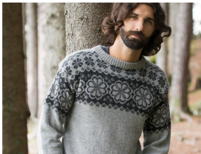
Se også i grå | DG406-14