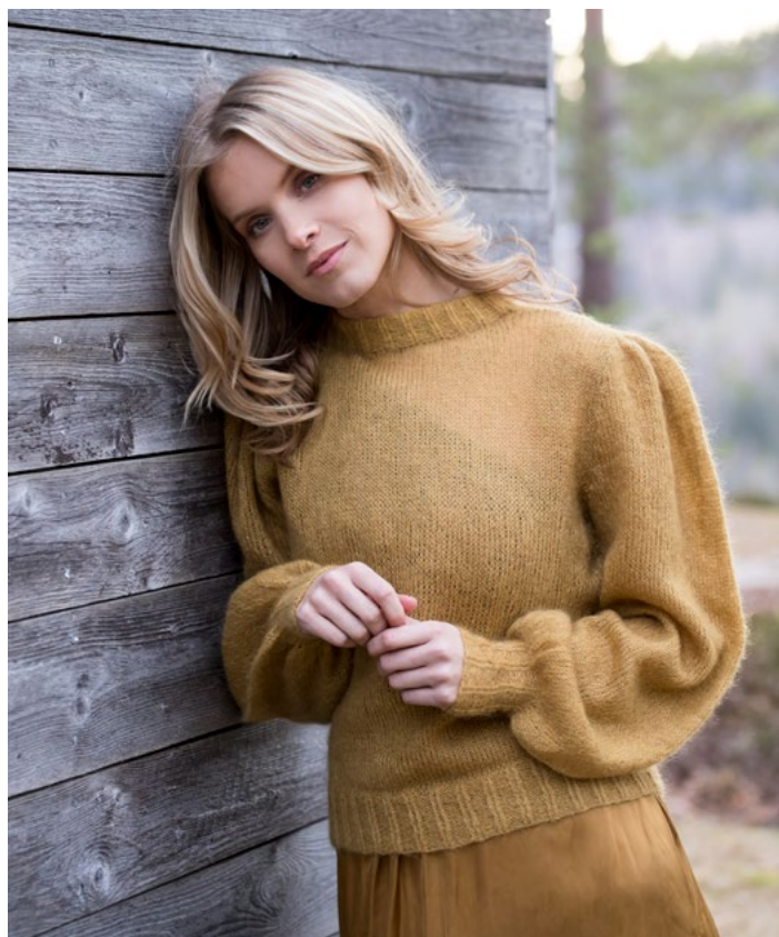
Se oppskrift på genser | DG408-03