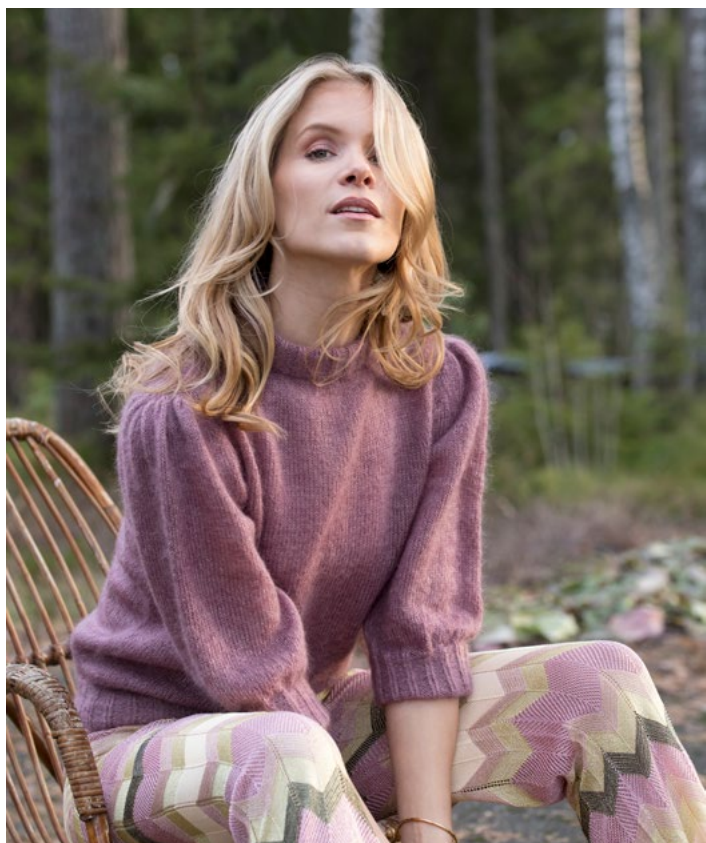
Se også jumper strikket i TYNN KIDSILK ERLE | DG408-04