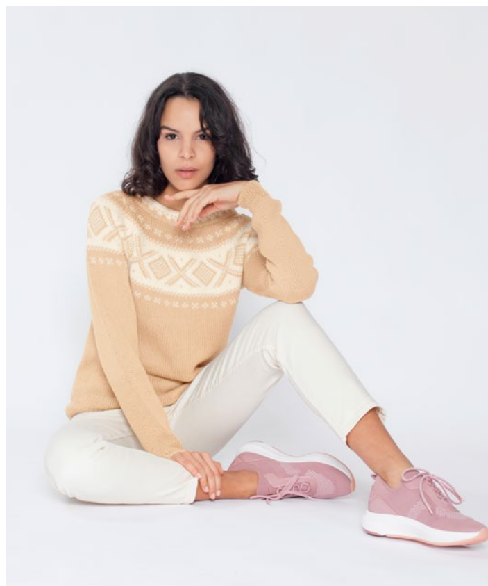
Se også i vanilje | DG410-03