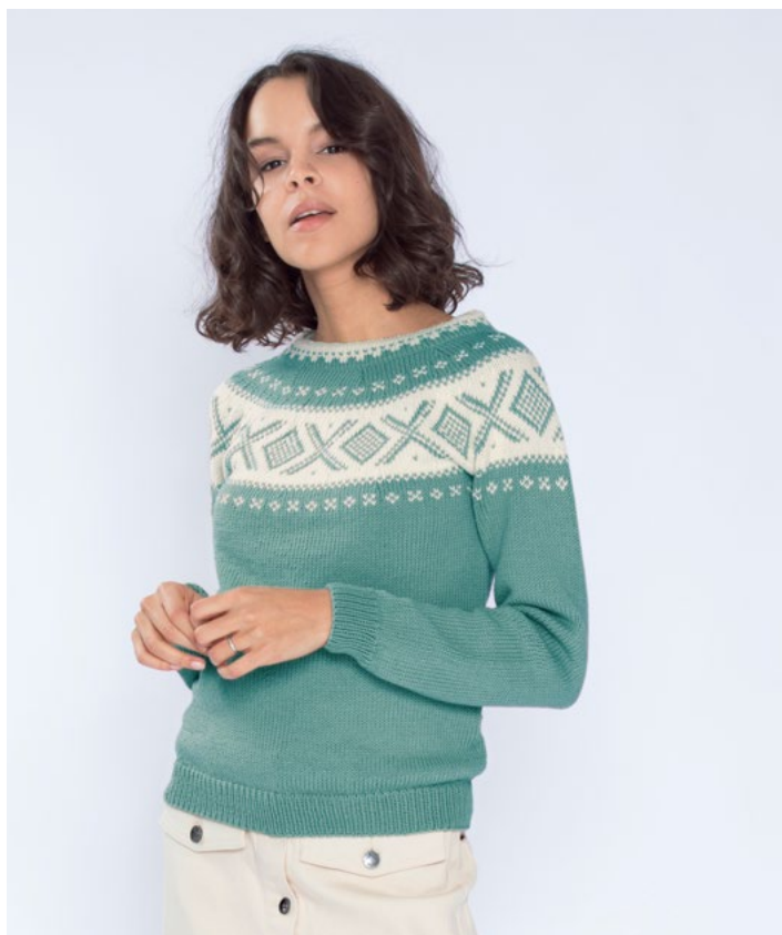
Se også i aqua grønn | DG410-02