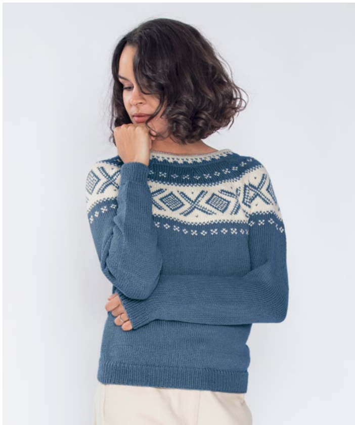
Se også i denim | DG410-06