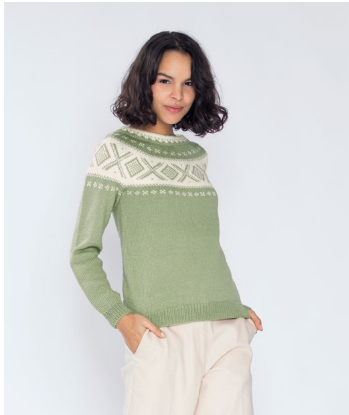
Se også i pistasj | DG410-01