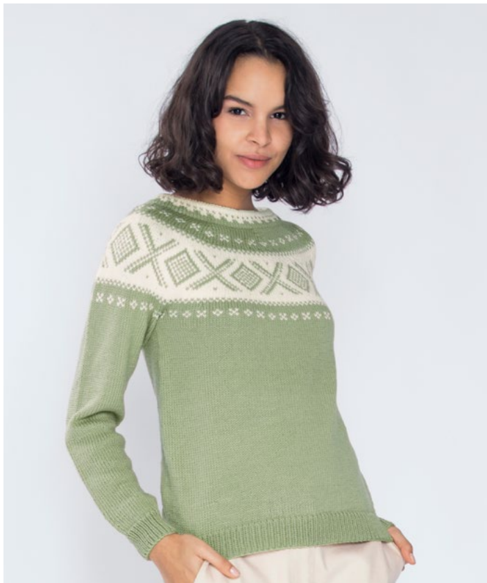
Se også i pistasj | DG410-01