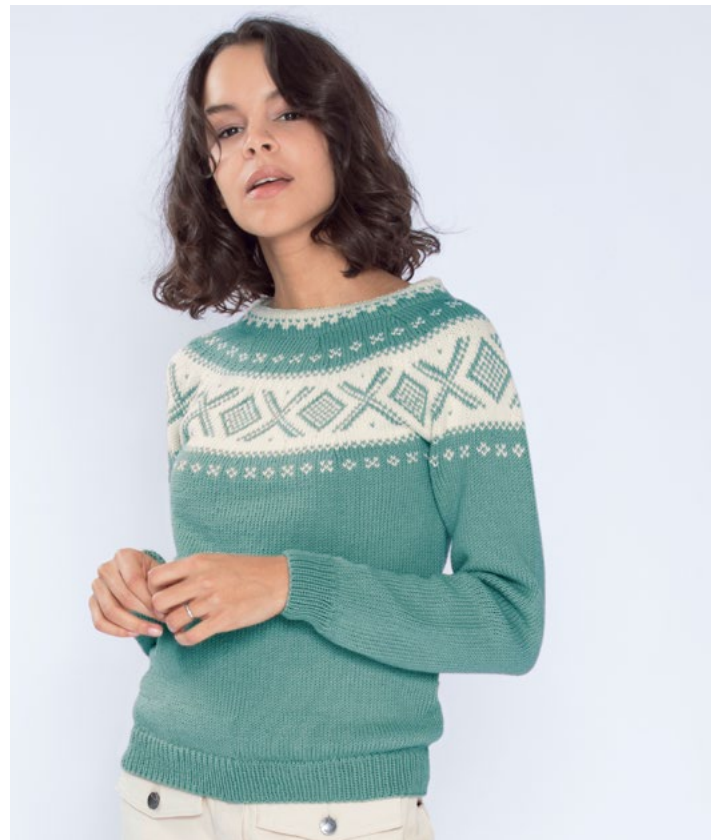
Se også i aqua grønn | DG410-02