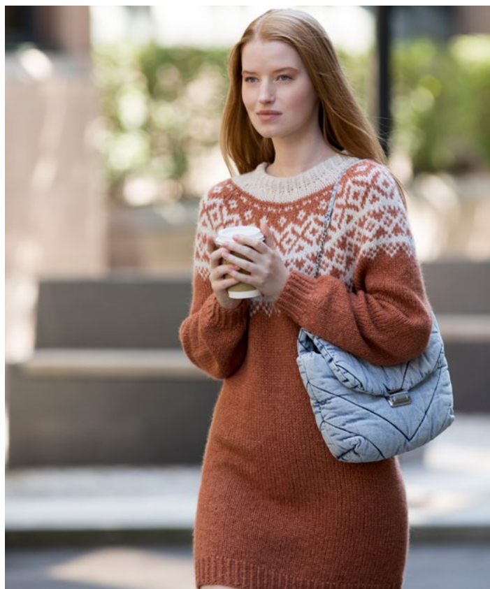
Se også i lang versjon | DG419-03