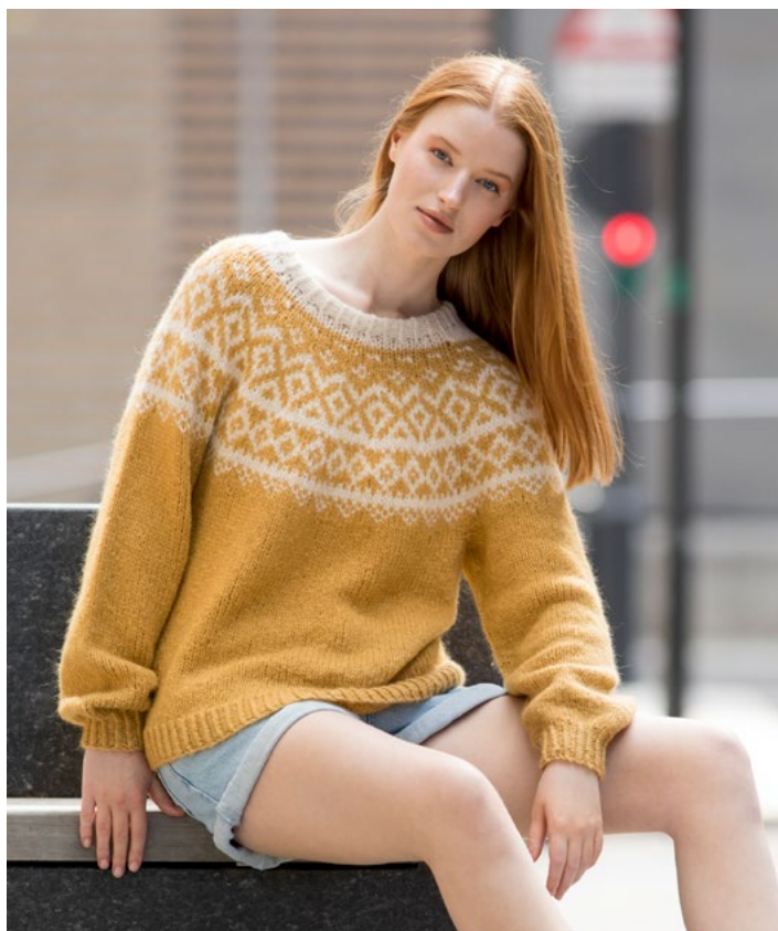
Se også i honninggul | DG419-10