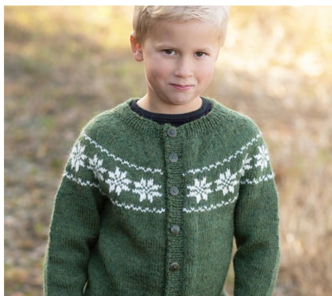
Prøv den som jakke | DG 420-03