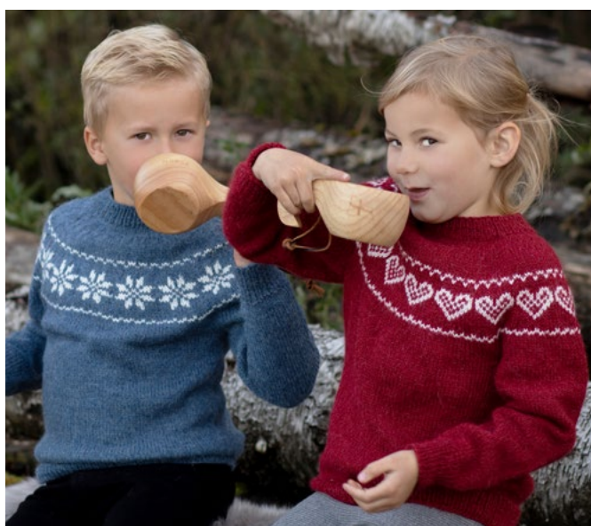
Prøv den i denim med stjerner | DG 420-01