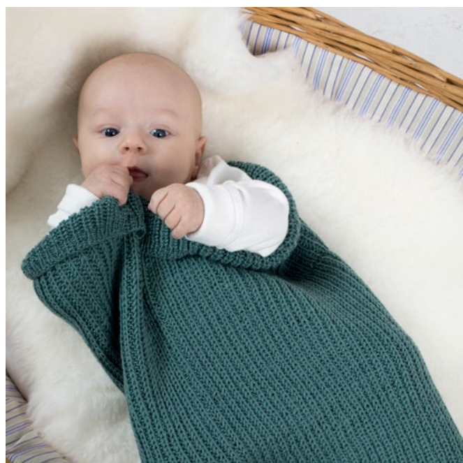
Prøv den i mørk jadegrønn | DG422-05