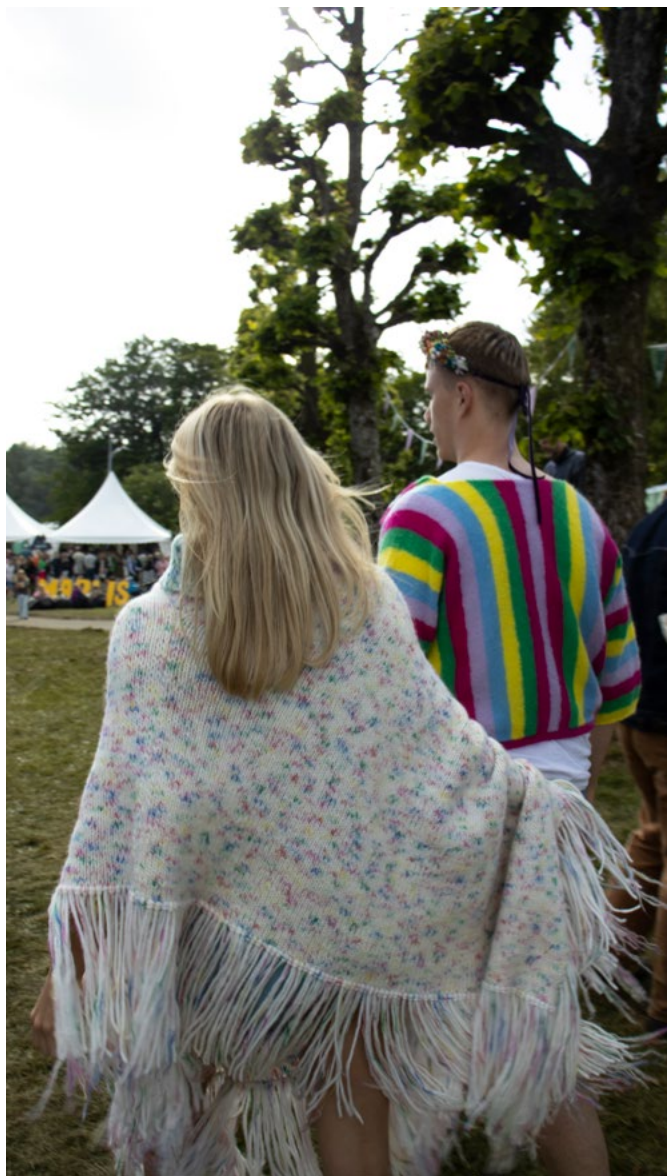
For oppskrift på stripet jakke se DG 455-01

Legg opp 118 m med 1 tråd i hver kvalitet på p nr 8. Strikk glattstrikk fram og tilbake (1. p = vrangen) til arbeidet måler 140 cm.