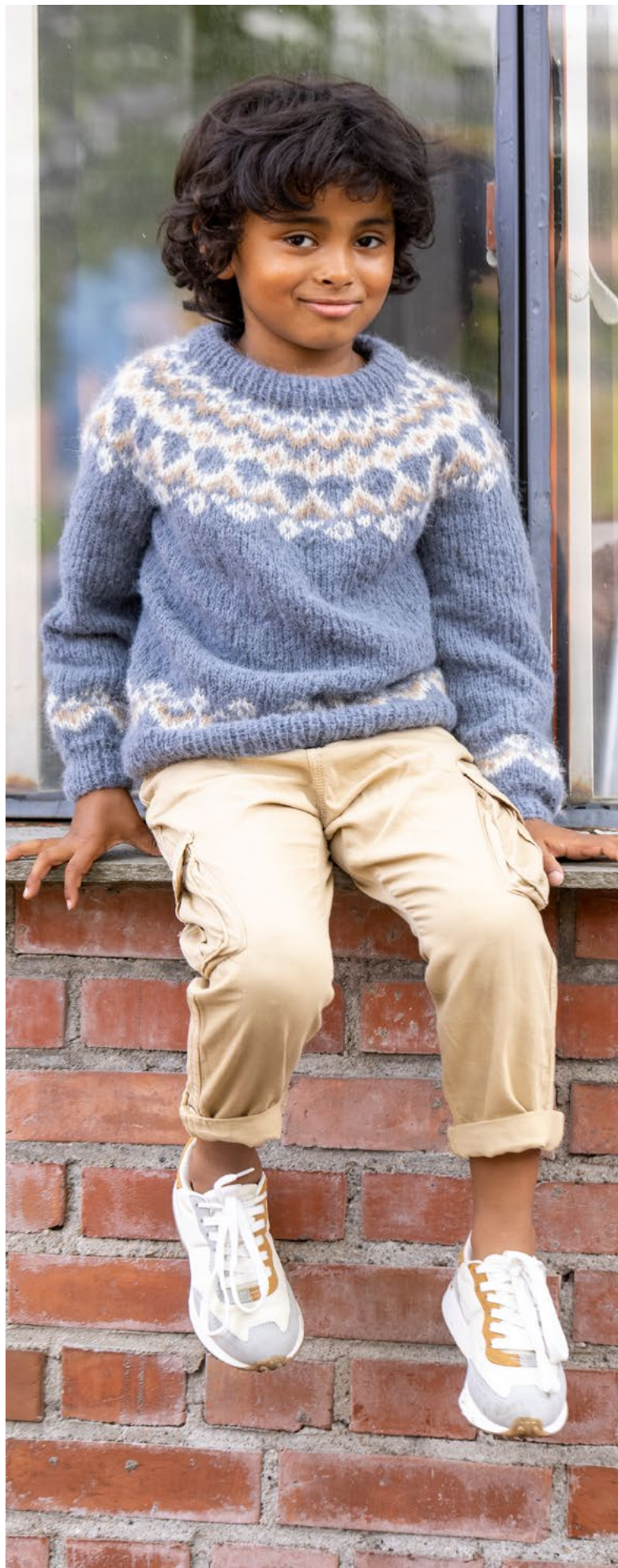
Stylist: Jan Gunnar Svenson @stylesvenson

Kopiering og publisering av materiale og oppskrifter, eller bruk av dette i næringsøyemed, er ikke tillatt uten avtale med House of Yarn AS.