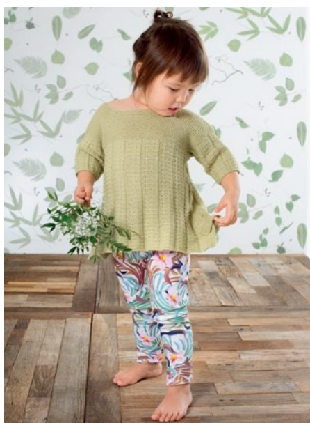
Prøv genseren i blekgul | DSA47-03A