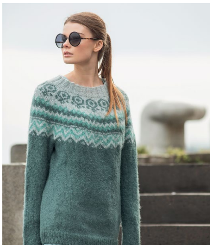
Prøv genseren i grågrønn | DSA55-07