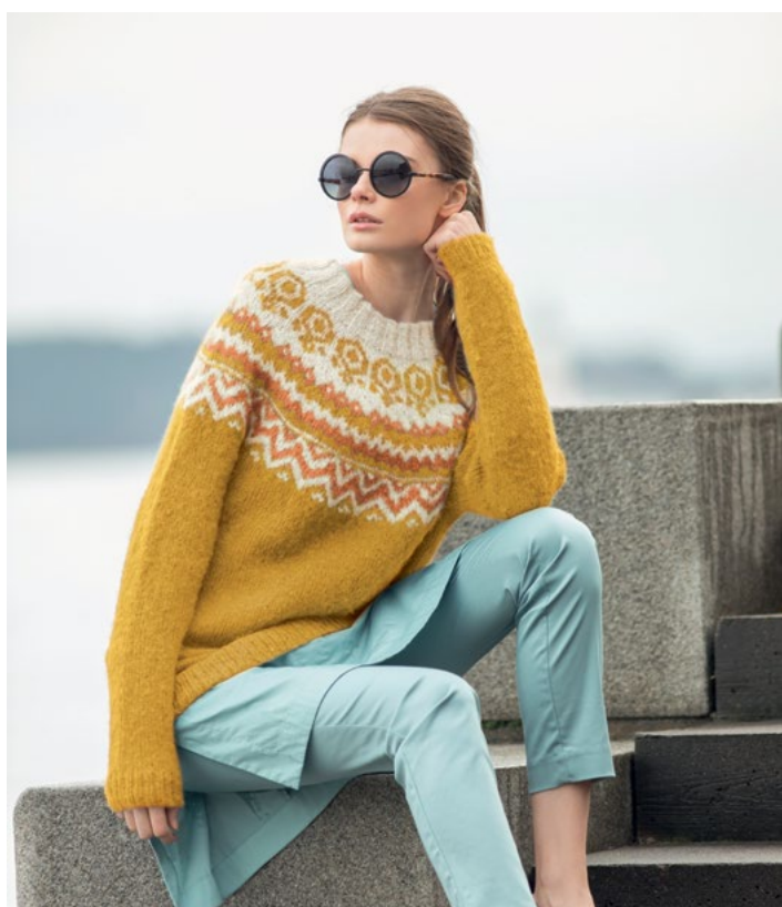
Prøv genseren i gullgul | DSA55-14