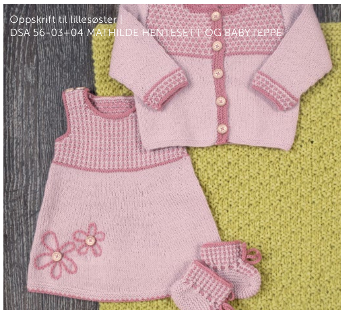
Oppskrift til lillesøster | DSA 56-03+04 MATHILDE HENTESETT OG BABYTEPPE