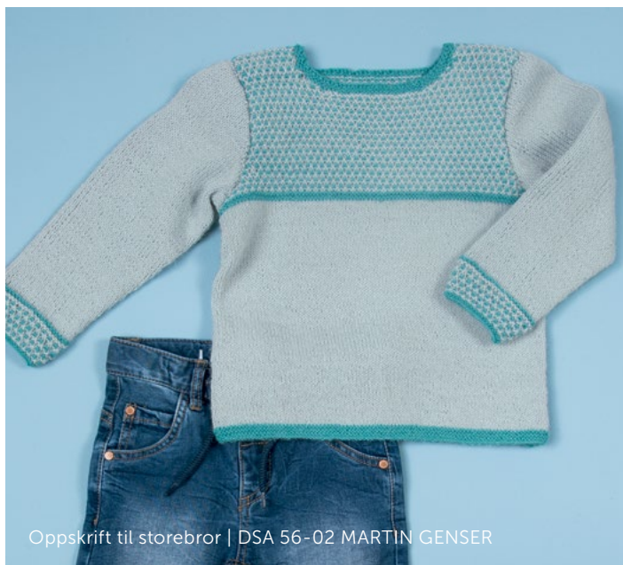
Oppskrift til storebror | DSA 56-02 MARTIN GENSER