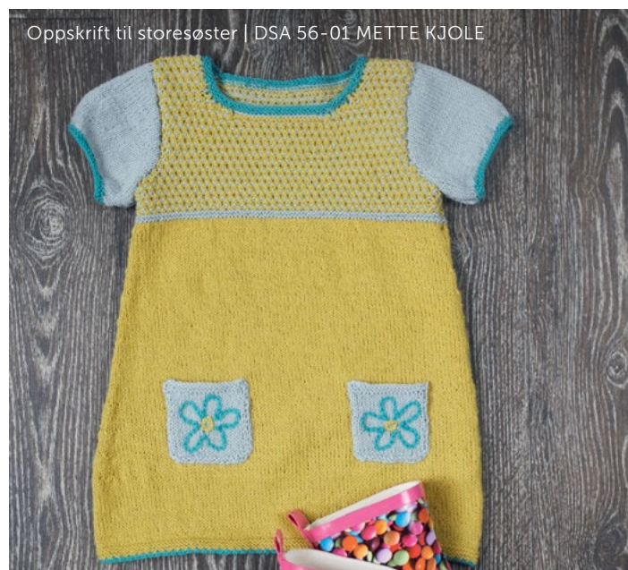
Oppskrift til storesøster | DSA 56-01 METTE KJOLE