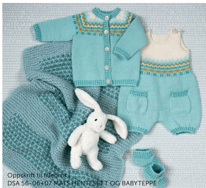
Oppskrift til lillebror | DSA 56-06+07 MATS HENTESETT OG BABYTEPPE