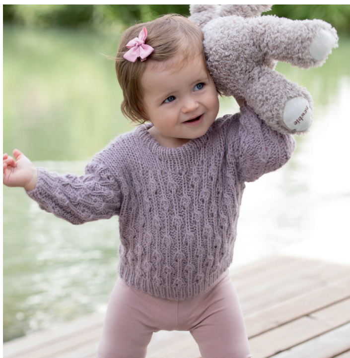
Oppskrift til lillesøster | DSA62-19