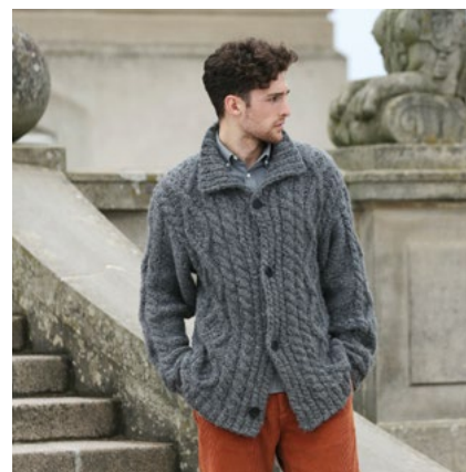
Prøv kardiganen i koks | DSA68-08