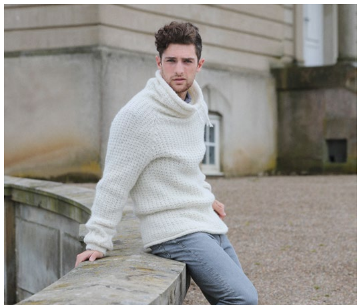
Prøv genseren i natur | DSA68-13