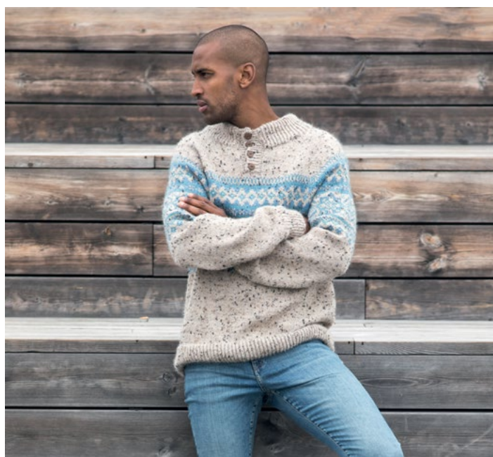
Prøv genseren i ALPAKKA TWEED CLASSIC | DSA70-12