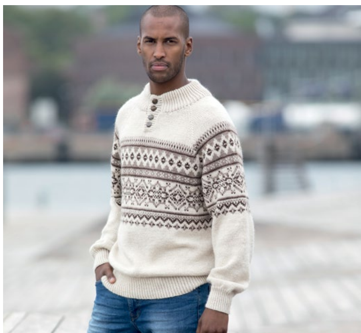
Prøv genseren i ALPAKKA WOOL CLASSIC | DSA70-11