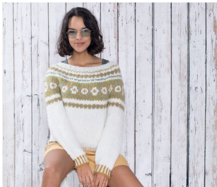
Se også som genser | DSA75-05