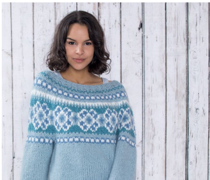
Se også som genser | DSA75-04