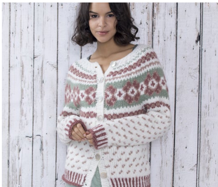
Se også som cardigan | DSA75-01