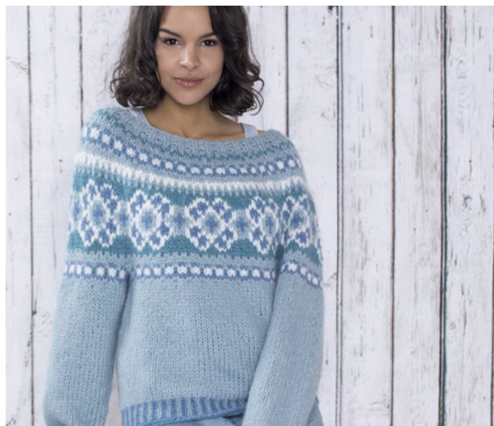
Prøv genseren i lys blå | DSA75-04