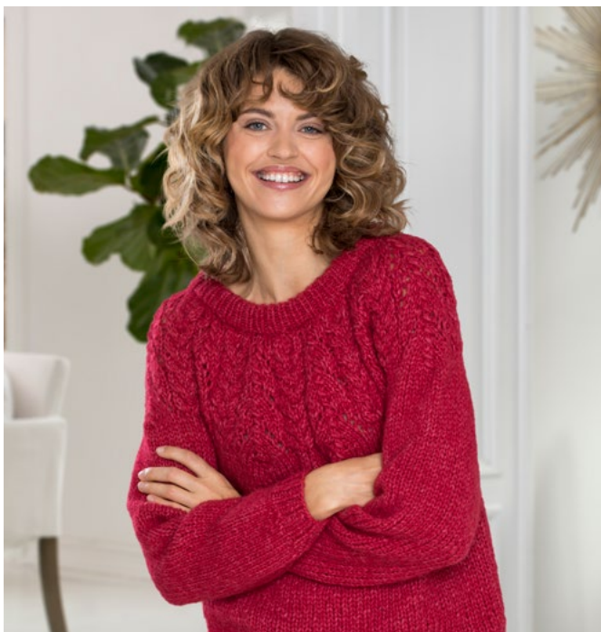
Prøv den i rød | DSA75-08