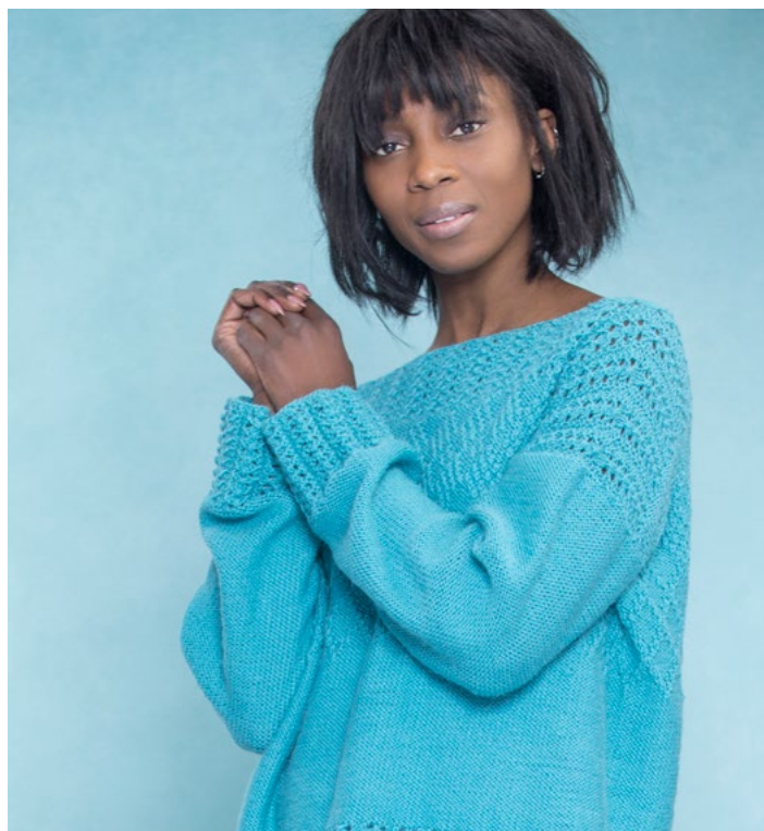
Prøv genseren i turkis | DSA76-01