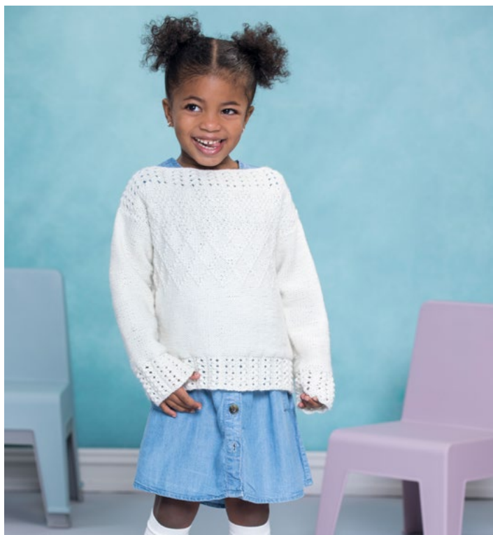
Se også genser til barn | DSA76-02