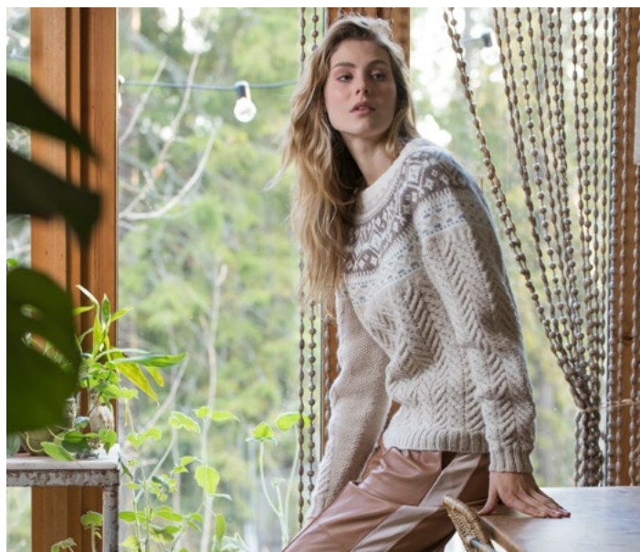
Prøv genseren i beige | DSA77-01