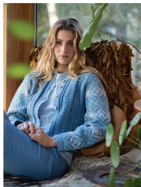
Prøv cardiganen i blå | DSA77-09