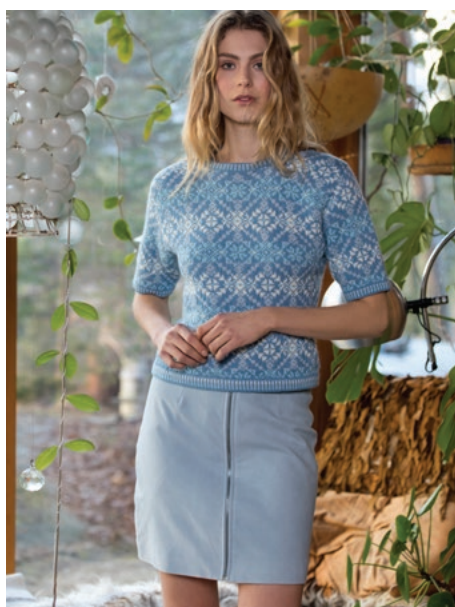
Se også oppskrift på jumper | DSA77-11