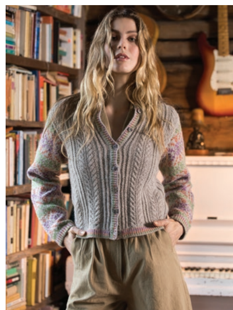
Prøv cardiganen i beige | DSA77-08