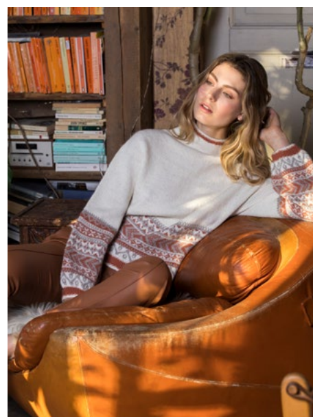
Prøv genseren i natur | DSA77-15