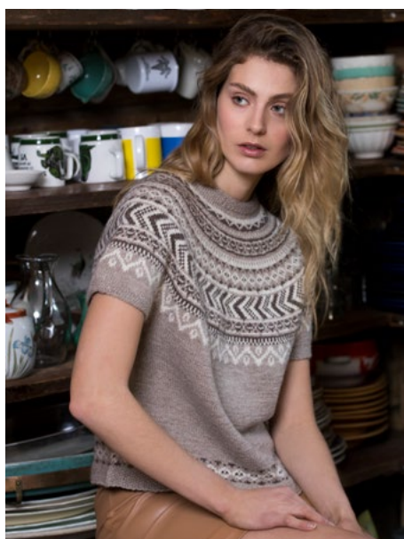
Se også oppskrift på topp | DSA77-05